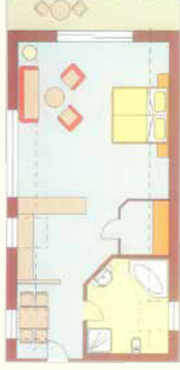
Sonnenspitze 65 qm im II. Stock