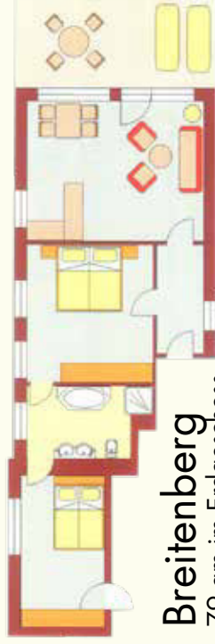
Breitenberg 79 qm im Erdgeschoss