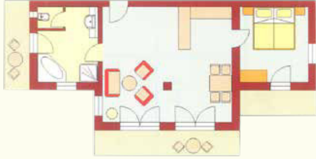
Hahnenkamm 69 qm im I. Stock

Kurhotel Eichinger • Hartenthalerstr. 22-26 • 86825 Bad Wörishofen Tel. 08247-39030 • info@kurhotel-eichinger.de • www.kurhotel-eichinger.de