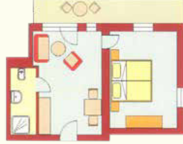
Wöller 40 qm im I. Stock