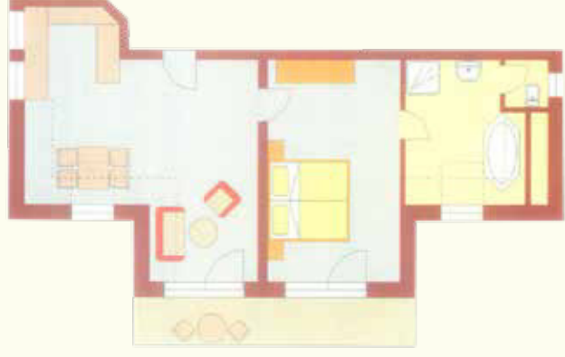
Hochvogel 61 qm im II. Stock