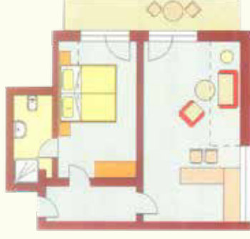
Falkenstein 50 qm im II. Stock