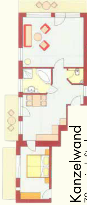
Kanzelwand 79 qm im I. Stock